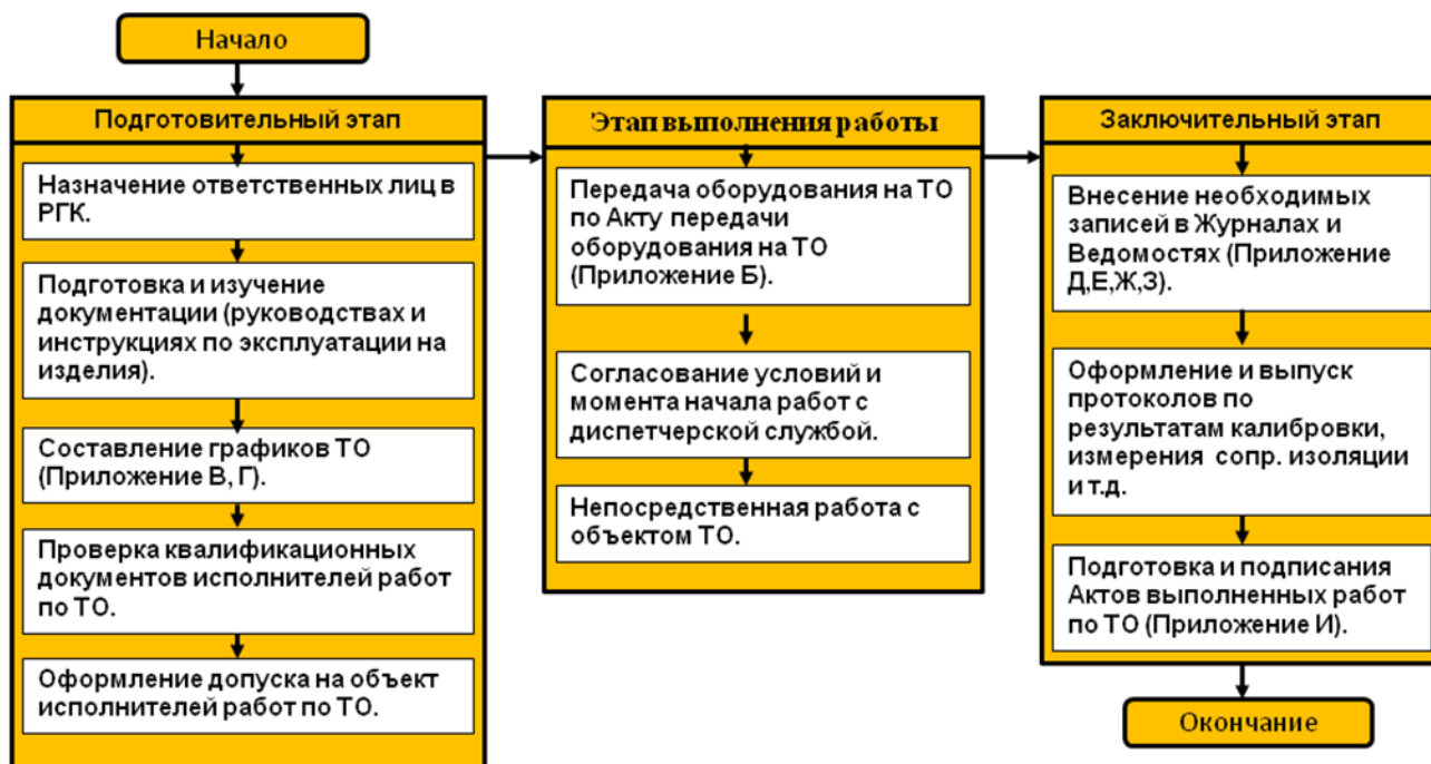
Рисунок 6.1 Этапы выполнения ТО

На Рисунке 6.1 представлены основные мероприятия этапов.